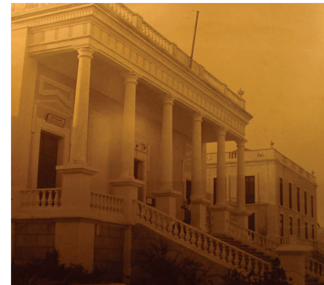
Hospital de Moçambique / Hospital da Ilha de Moçambique Projeto de Isaiás Newton. 1877

JLD / JMCD | Mais informação em: http://goo.gl/5Jk3PO