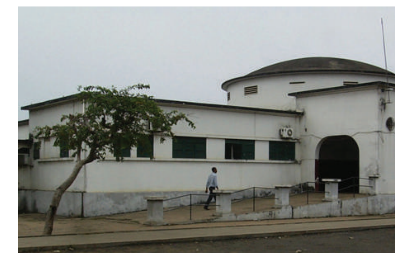
Dispensário Anti-Tuberculose de São Tomé / Ministério da Saúde de São Tomé e Príncipe Projeto de autor desconhecido. Inaugurado em 1951