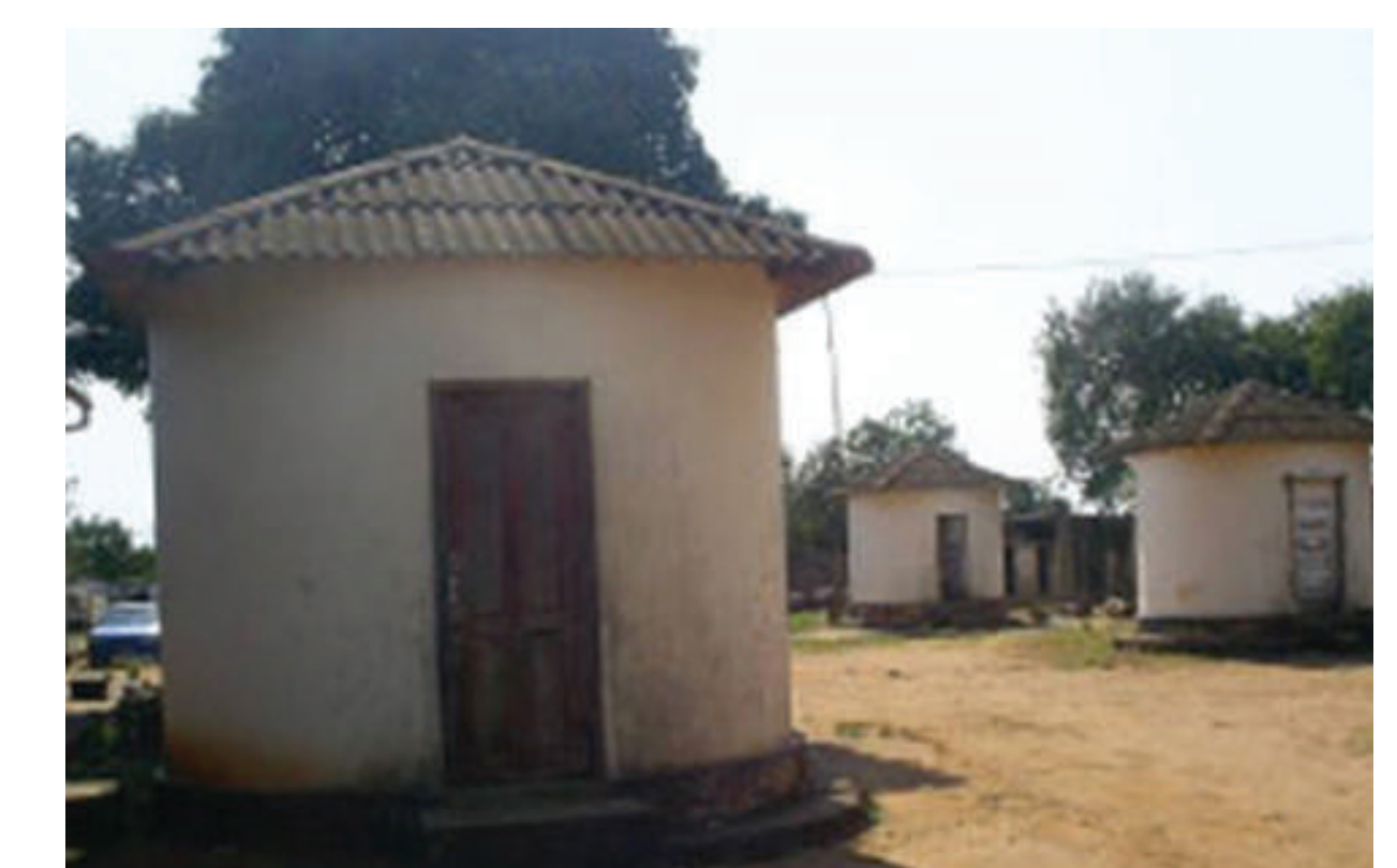
Formação Sanitária de Maputo / Rondável do Centro de Saúde da Bela Vista – Moçambique Projeto de autor desconhecido. c.1930