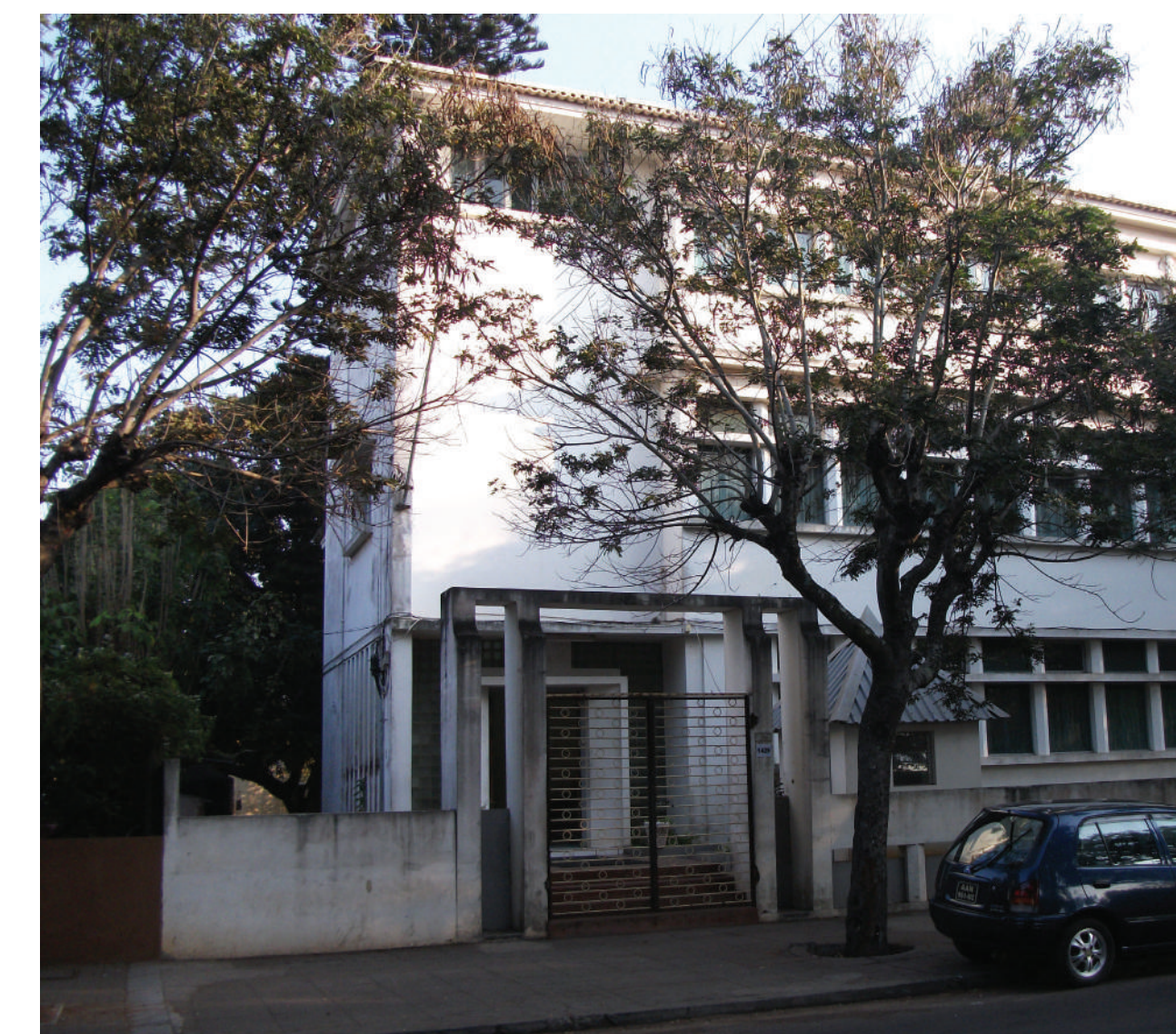
Sede da Missão de Combate às Tripanossomíases (MCT), Lourenço Marques / Instituto Superior de Ciências da Saúde, Maputo – Moçambique Projeto de autor desconhecido. 1949