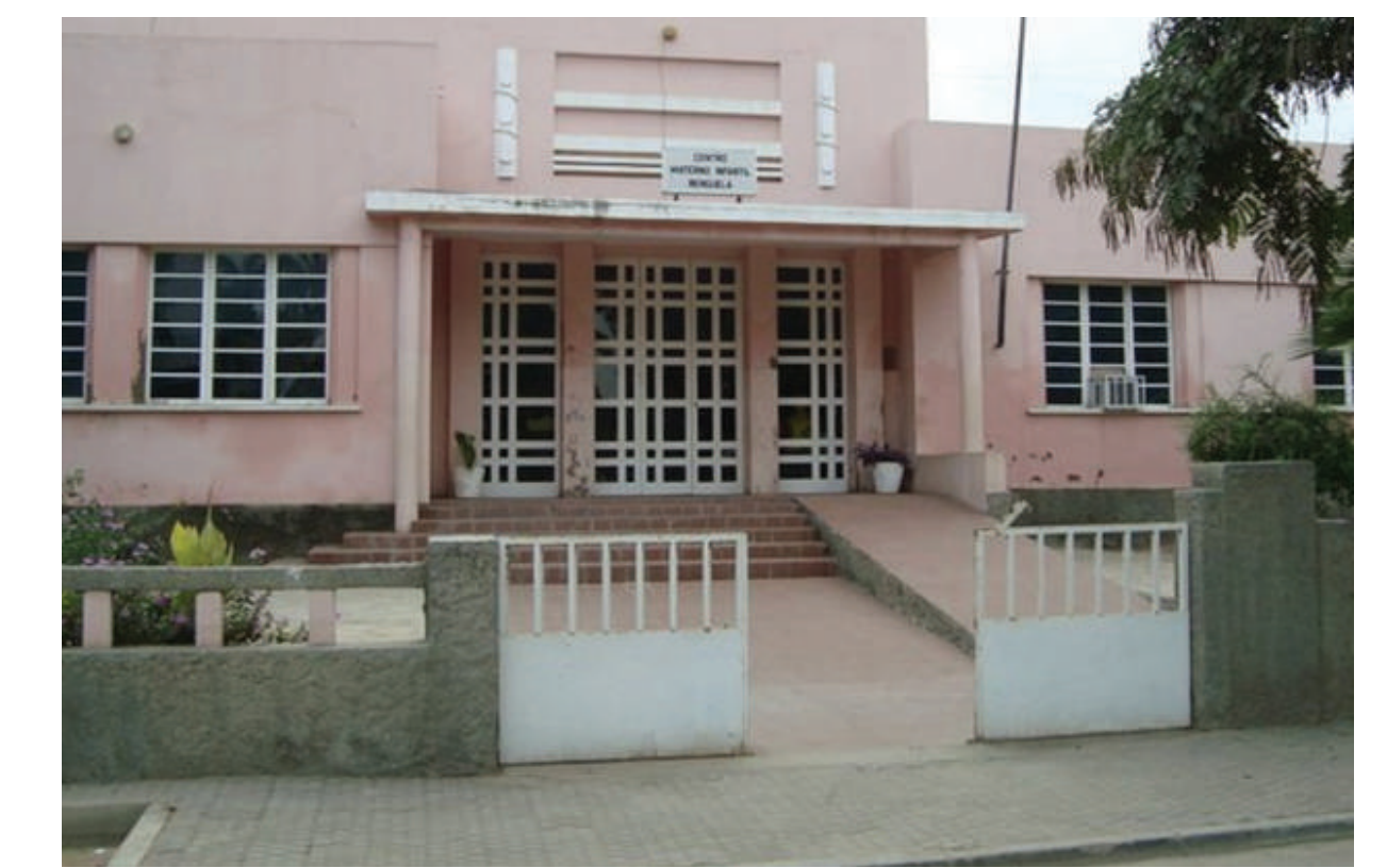
Dispensário de Benguela – Instituição de Assistência às Crianças Indígenas (IACI) / Centro Materno-Infantil de Benguela, Angola. Projeto de autor desconhecido. Inaugurado em 1940