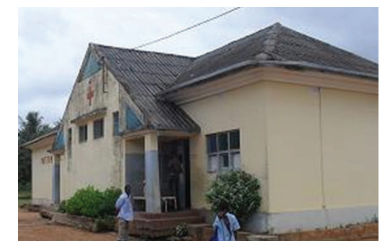
Maternidade Tipo, Moçambique / Maternidade do Centro de Saúde de Cumbana – Moçambique Projeto do Gabinete de Urbanização Colonial (GUC). 1946