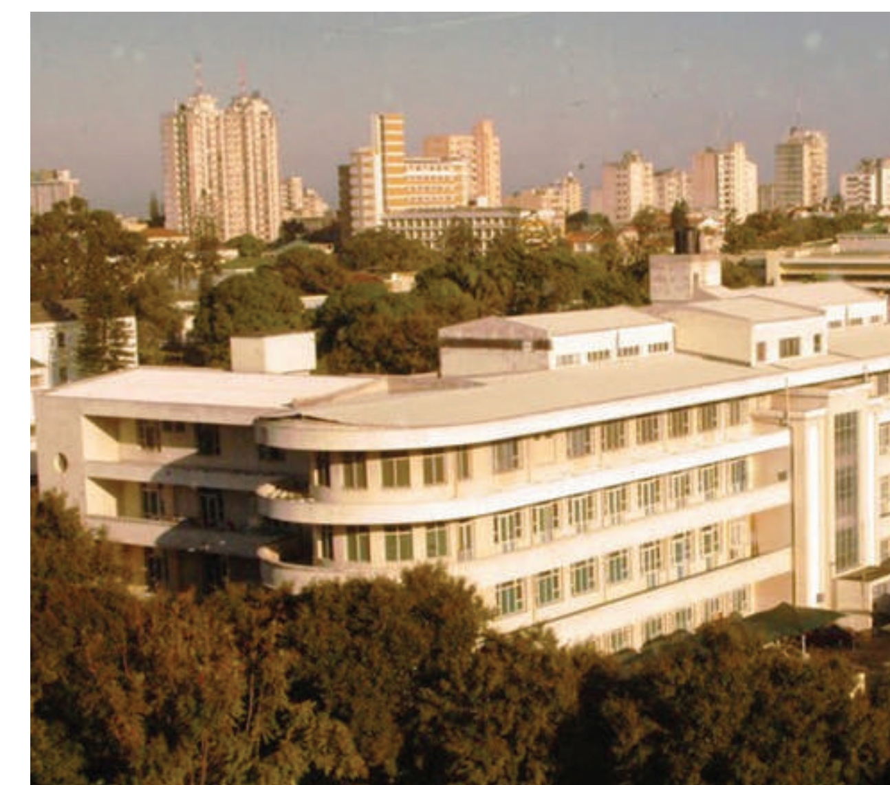
Pavilhão de Isolamento para Europeus do Hospital Miguel Bombarda / Departamento de Obstetrícia e Ginecologia do Hospital Central de Maputo – Moçambique Projeto de autor não identificado. 1940