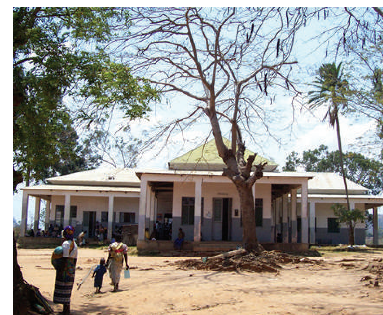
Hospital do Zóbuê – Moçambique Projeto de Mário Fernandes. c.1940